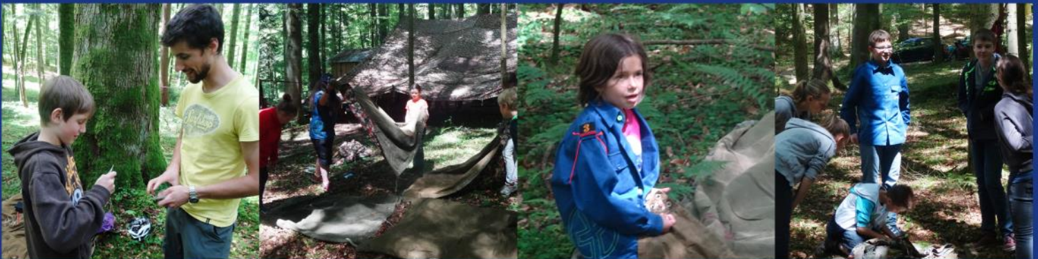
Lageraufbau für das Pfila 2014