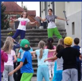
KUW 7. Klasse Sek B

Mehr Fotos und Videos auf www.kirche-kirchberg.ch/Jugendseiten