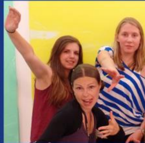
Roundabout: Girlicious Camp 2014 in Sursee