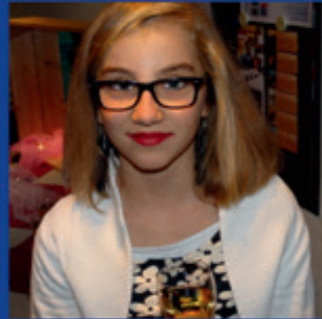
Geburtstag-Party: 5 Jahre roundabout