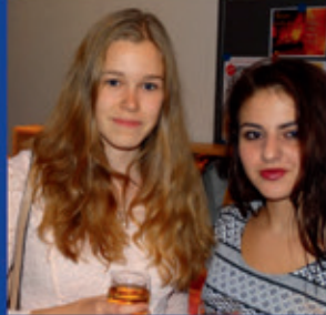
Geburtstag-Party: 5 Jahre roundabout