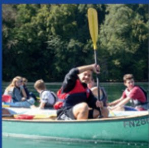
ONLINE - 7 ab 7

Mehr Fotos und Videos auf www.kirche-kirchberg.ch/Jugendseiten