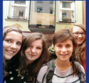
KOLA Konf: I4 Sek A / Sek B