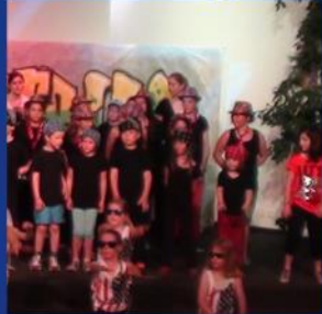
Street Dance for Street Kids -Benefiz-Veranstaltung