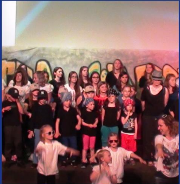
Street Dance for Street Kids -Benefiz-Veranstaltung